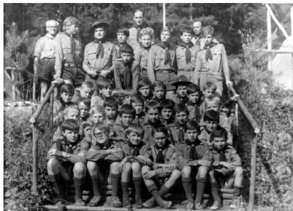
Účastníci tábora v roce 1970